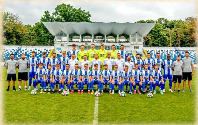
Echipa din dealul Copoului.